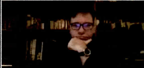
Antonio Leoni Instituto de Investigaci...