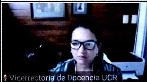
Vicerrectoría de Docencia UCR